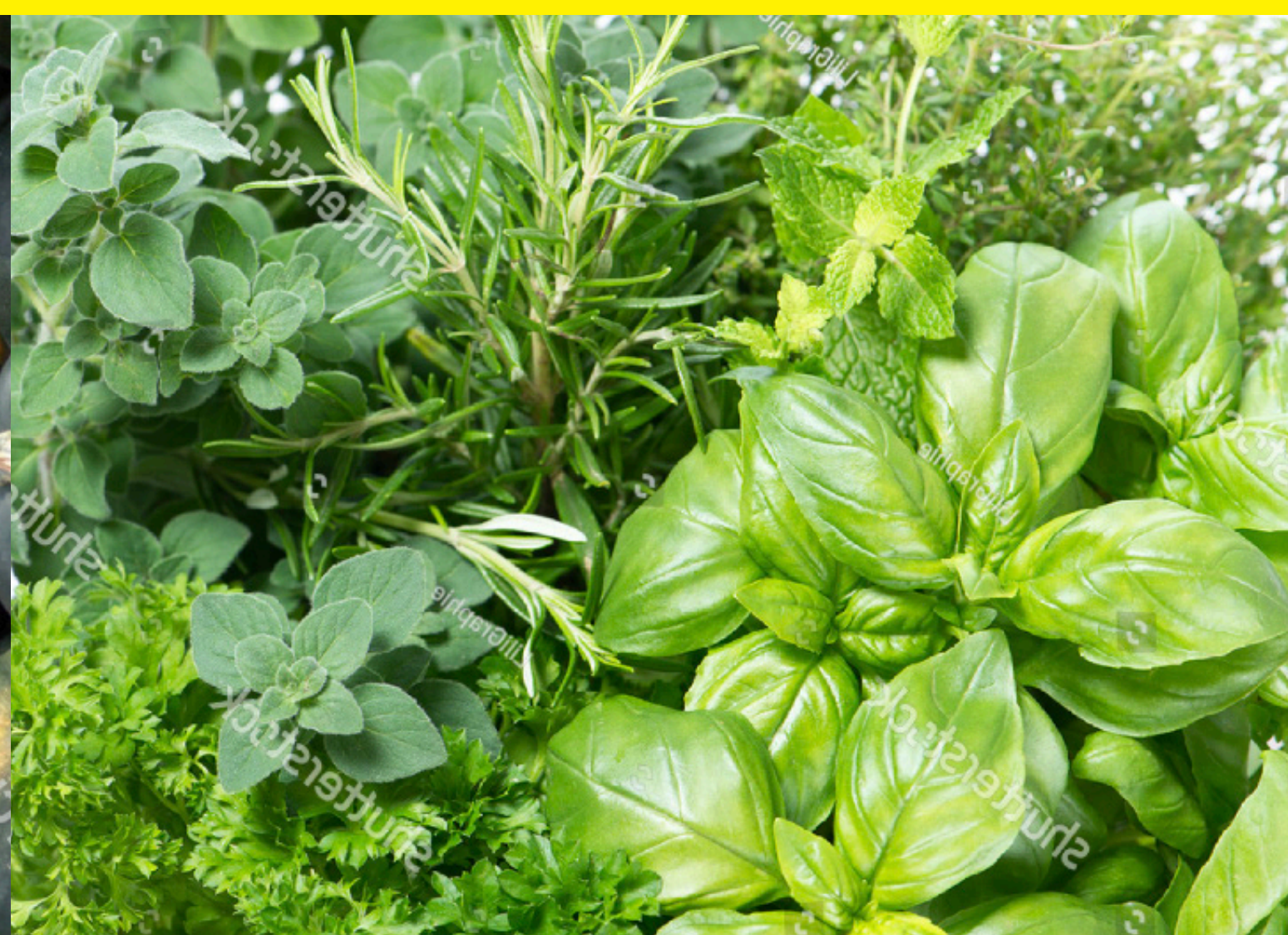
NOVEMBER fresh herbs