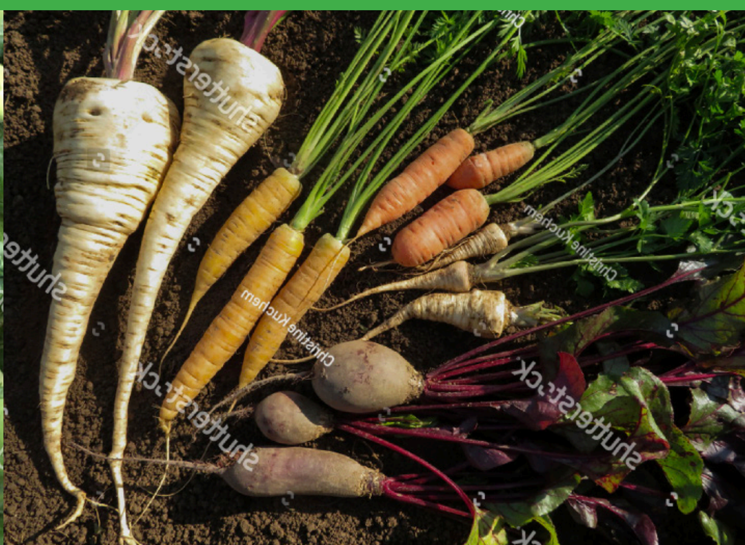
JANUARY root vegetables