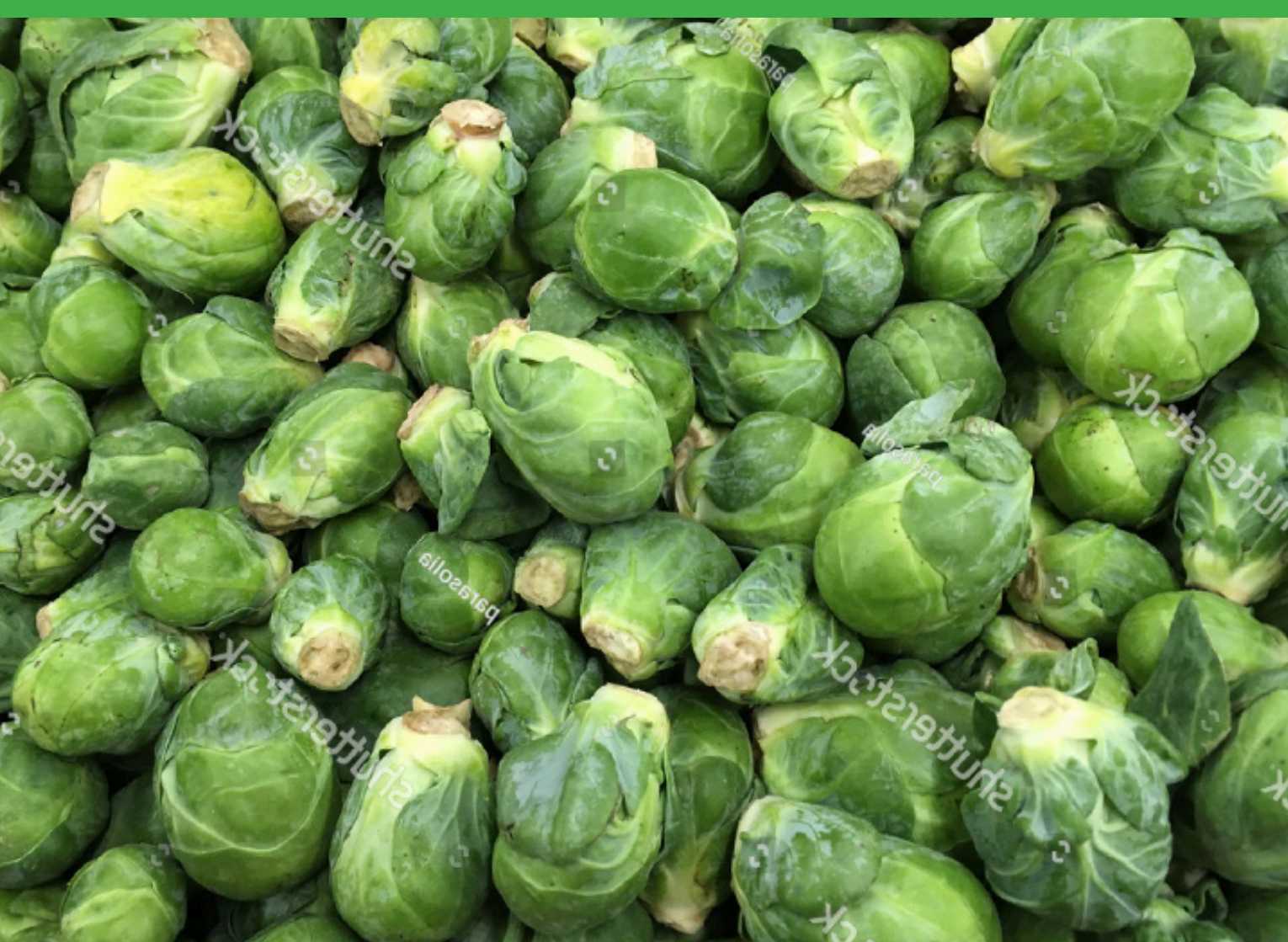
DECEMBER brussel sprouts